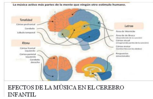
EFFECTOS DE LA MÚSICA EN EL CEREBRO INFANTIL